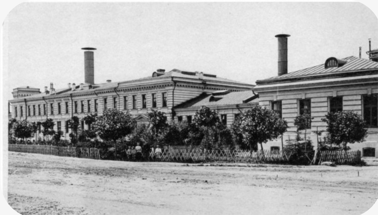
Здание Институты гигиены, общей патологии и фармакологии. Архивное фото 1896 г. (из книги "Архитектурное наследие К.М. Быковского в Москве")