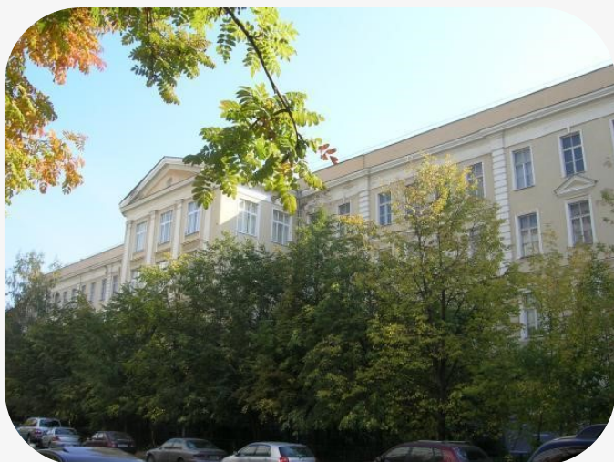
Здание корпуса Института общественного здоровья им. Ф.Ф. Эрисмана в 2020 году (со стороны Погодинской улицы)