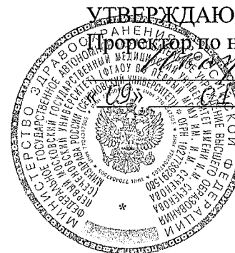
ГРАФИК заседаний диссертационных советов ФГАОУ ВО Первый МГМУ им. И.М. Сеченова Минздрава России