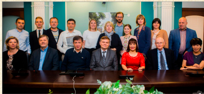
Заседание Руководящего комитета Erasmus+ IHOD Project (3 июня 2019 г., г. Москва, Сеченовский Университет)

Кафедра плодотворно сотрудничает с кафедрой общественного здоровья и здравоохранения с курсом ФПКП Гомельского государственного медицинского