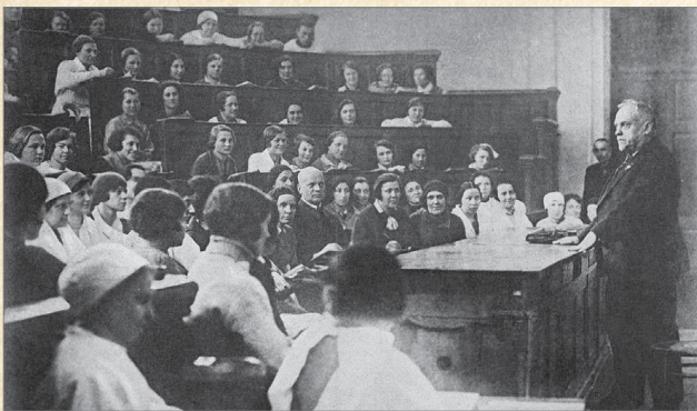
Н.А. Семашко читает лекцию студентам 1-го ММИ. 1937 г.

История социальной гигиены, ныне дисциплины «общественное здоровье и здравоохранение» как предмета преподавания начинается со знаменательной даты – 20 февраля 1922 г. В этот день Н.А. Семашко прочитал студентам медицинского факультета университета первую лекцию на тему: «Социальная гигиена, ее сущность, метод и значение». В этом же году дисциплина «социальная гигиена» была включена в учебный план 1922/23 учебного года 1 МГУ.