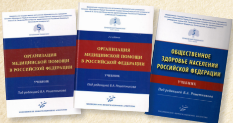
Учебные издания кафедры, выпущенные в 2018–2022 гг.

Профессорско-преподавательский состав кафедры создает новые учебники и учебно-методические материалы, совершенствует методы преподавания дисциплины «общественное здоровье и здравоохранение».