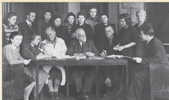
Н.А. Семашко с участниками научного студенческого кружка кафедры организации здравоохранения 1-го Московского Ордена Ленина медицинского института, 1945 г.

В 1941 г. кафедра социальной гигиены была переименована в кафедру организации здравоохранения 1 Московского ордена Ленина медицинского института (1 МОЛМИ).