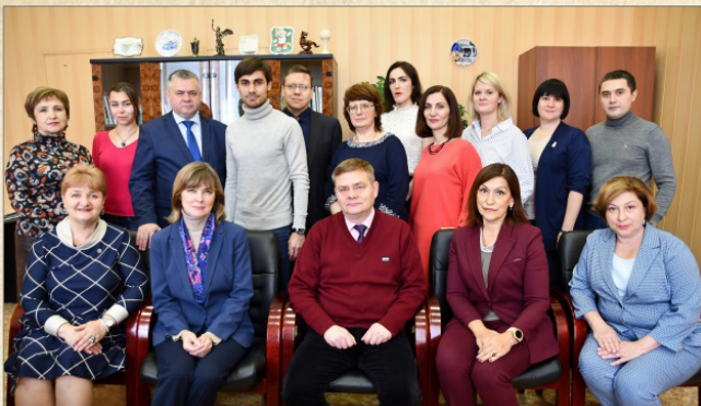
Коллектив кафедры (Москва, 2019 г.)

Лечебное дело», «Бакинский филиал. Лечебное дело», «Англоязычные. Лечебное дело» и др., а также ординаторов, магистрантов и аспирантов.