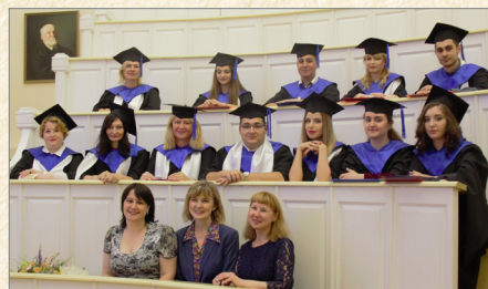
Торжественная церемония вручения дипломов выпускникам магистратуры (июнь 2019 г., г. Москва, Сеченовский Университет)

В 2022 г. Сеченовский Университет приступает к выполнению нового большого проекта в рамках государственной Программы стратегического академического лидерства «Приоритет-2030». В связи с этим на ближайшее десятилетие перед сотрудниками кафедры стоят серьезные, амбициозные задачи.