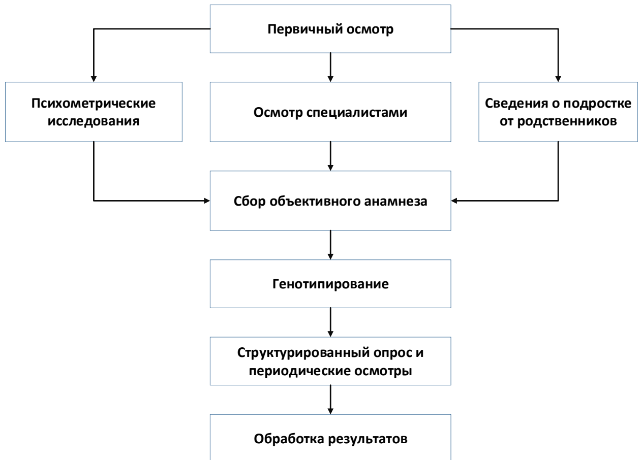
Рисунок 2.2 Дизайн исследования

В соответствии с этапами разработан дизайн исследования (Рисунок 2.2).