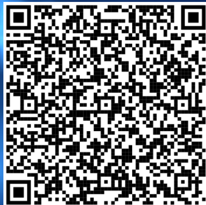
Перечень программ (Приложение №1)