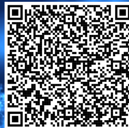
Контрольные цифры приема